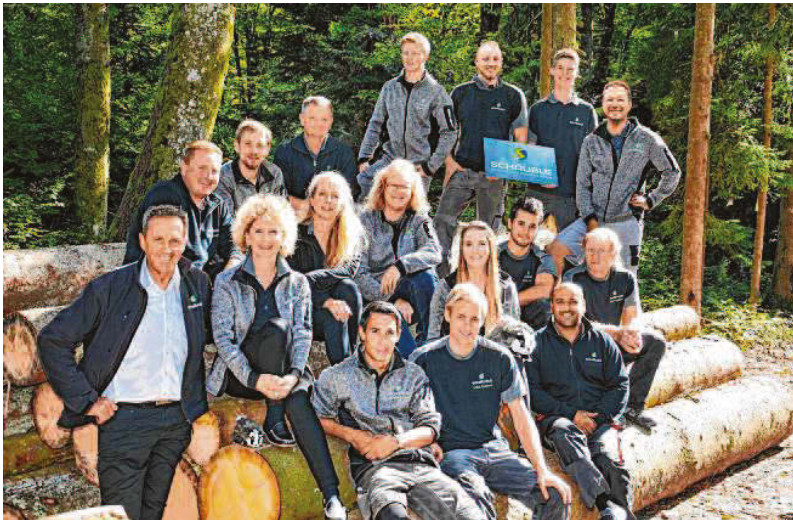
Die Firma Schäuble Regenerative Energiesysteme aus Rickenbach/Hottingen bürgt für Qualität und Sicherheit, wenn es um umweltschonende und energiesparende Heiztechnik und die Nutzung von regenerativen Energien geht.