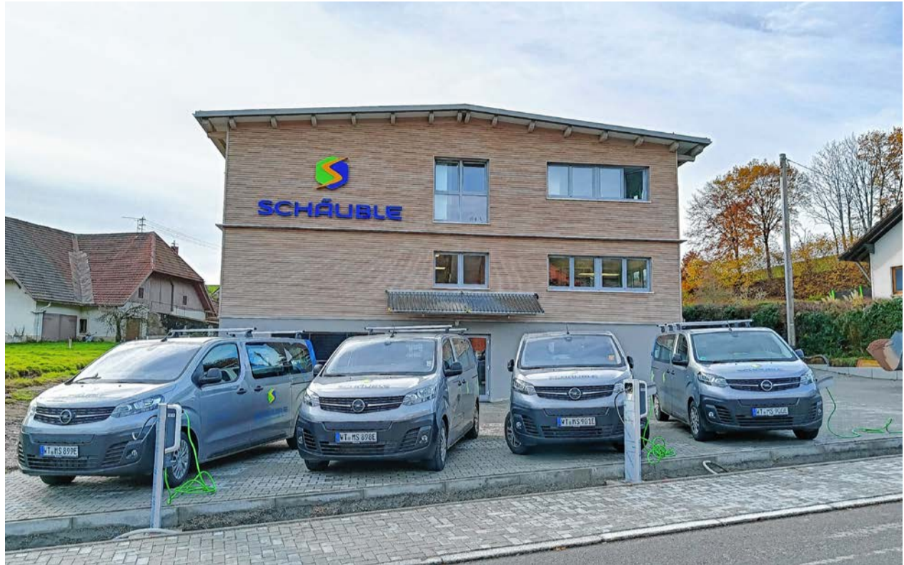
Das neue Firmengebäude der Firma Schäuble Regenerative Energiesysteme in der Murgtalstraße 10 in Rickenbach-Hottingen.

Erstellt wurde das Gebäude im KfW-40-Plus-Standard und soweit möglich CO 2 -neutral als klimaneutrales Gebäude. Das Bürogebäude ist dreigeschossig. Die Grundfläche beträgt zehn auf 15 Meter. Als Nutzfläche stehen 450 Quadratmeter zur Verfügung. Das Untergeschoss und die Bodenplatte wurden in Massivbauweise errichtet. Die zwei darüber liegenden Geschosse wurden als Holzrahmenkonstruktion ausgeführt. Das moderne Lager-